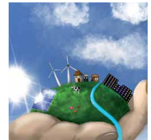
Многие современные люди просто не знают, как экономить. Экономия электроэнергии предполагает использование энергосберегающих ламп, выключателей света, энергосберегающих стиральных машин, посудомоечных машин, энергосберегающих холодильников. Также можно использовать солнечные батареи, ветряные турбины, гидроэнергетику. Для экономии энергии можно использовать энергосберегающие лампы, выключатели света, энергосберегающие стиральные машины, посудомоечные машины, энергосберегающие холодильники. Также можно использовать солнечные батареи, ветряные турбины, гидроэнергетику.