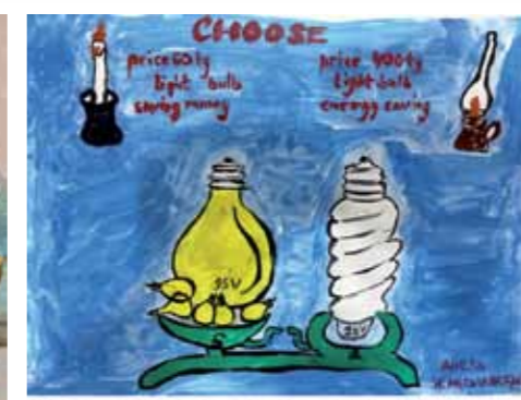
Мне было около 4-5 лет, когда родители объяснили мне о потреблении энергии и какой вред это приносит природе. С тех пор я стала экономить электроэнергию и телевизор или свет в комнате, если я этого не нуждаюсь. Также я всегда стараюсь экономить воду и электричество, чтобы не загрязнять окружающую среду, экономить ее потребление.