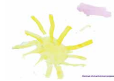
Каждый грамотный человек знает о необходимости рационального потребления энергии в квартире, доме, в масштабах города для: 1) сохранения окружающей среды 2) улучшения условий проживания 3) даже для экономии бюджета семьи. Поэтому, энергосбережение так важно. Это задача глобального характера, и все же зависит от каждого из нас. Нужно беречь природу, потому что это единственное, что есть у человечества.