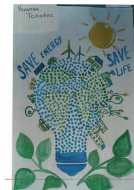
Экономь электроэнергию, мы экономим будущее! Сейчас очень много солнечных батареек, ветряных генераторов и т.д. за экологию природы!