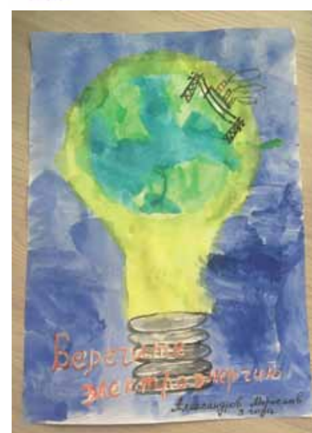
Мы должны беречь электроэнергию. Для этого мы экономим свет, экономим электроэнергию от телевизора, когда мы выключили из дома, экономим воду при мытье посуды, чтобы не загрязнять природу.