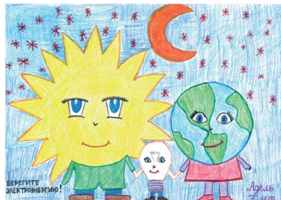
Главная идея рисунка это правильное использование электроэнергии. Можно использовать солнечную энергию и природные ресурсы для получения электричества. От правильного использования энергии земли зависит экология нашей Земли.