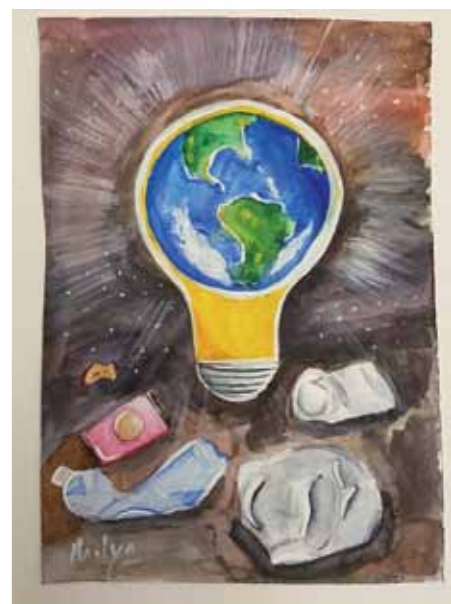
Идея рисунка: защита природы от загрязнения и экономия электроэнергии.