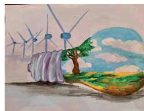
Для природы здоровье. Экономить энергию можно: ставить лампы дневного света, использовать термометры, чтобы не замерз и согреть для выработки энергии.