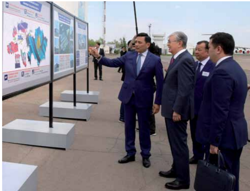
Karachaganak Petroleum Operating allocated 2.4 bn.tenge for the airport modernization.

"Uralsk is our main gate to Europe. In order to become attractive for foreign investments, it is important to perform such projects qualitatively and on time", said President Tokayev.