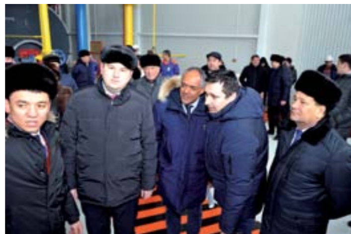
place in Burlin District.

Besides, two more inaugurations of social projects took