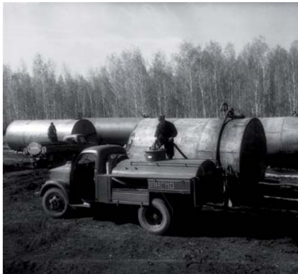
9. Бензовоз на нефтебазе зерносовхоза "Ленинский", снабжающий горючим тракторы во время полевых работ. Северо-Казахстанская область, 1955 г.