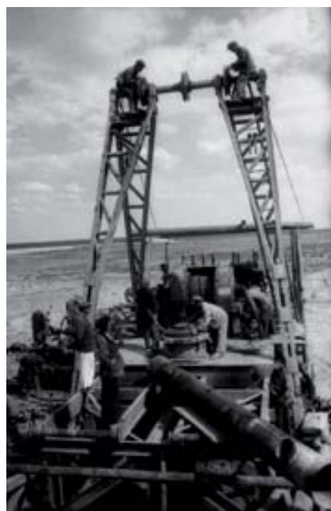
8. Великая Отечественная война не только унесла миллионы жизней, но и оставила после себя полную разруху экономики. 50-е годы ознаменовываются активными геолого-разведочными работами, в результате которых открываются новые месторождения: Теренозек, Тажигали, Тюлес, Караарна и др. В начале 50-х годов добыча нефти в Казахстане достигает уровня 1 млн тонн в год. В это же время нефтяники начинают активно осваивать полуостров Мангышлак и его богатые залежи нефти