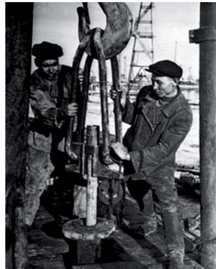
11. Мастера подземного ремонта скважин нефтепромысла Кульсары, Гурьевская область, 1955 г.