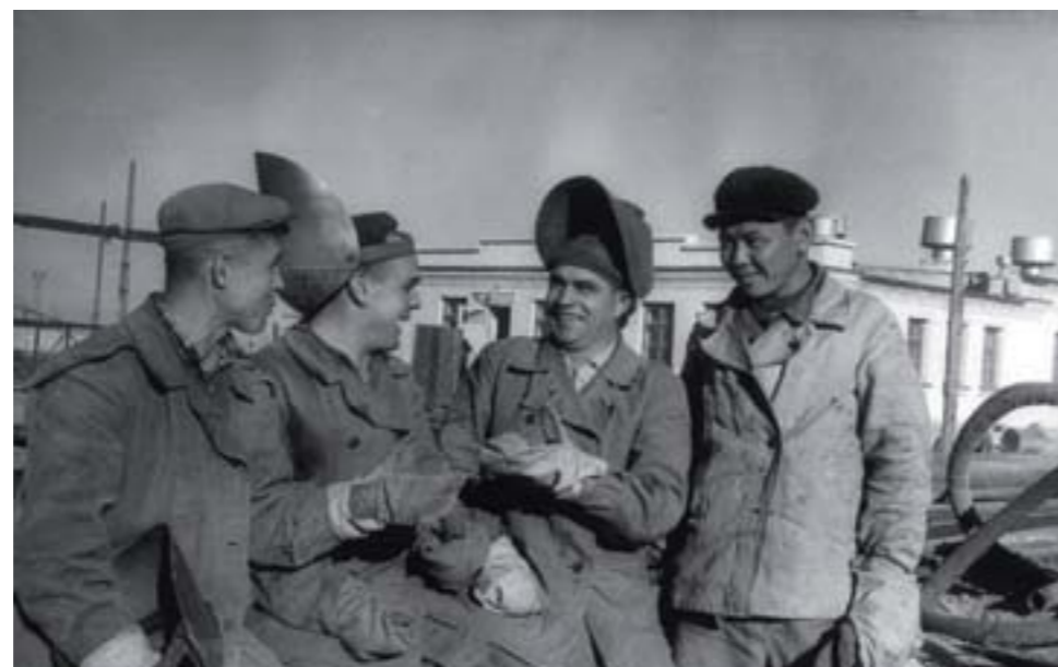
10. Электросварщики ремонтно-механического цеха Гурьевского нефтеперерабатывающего завода