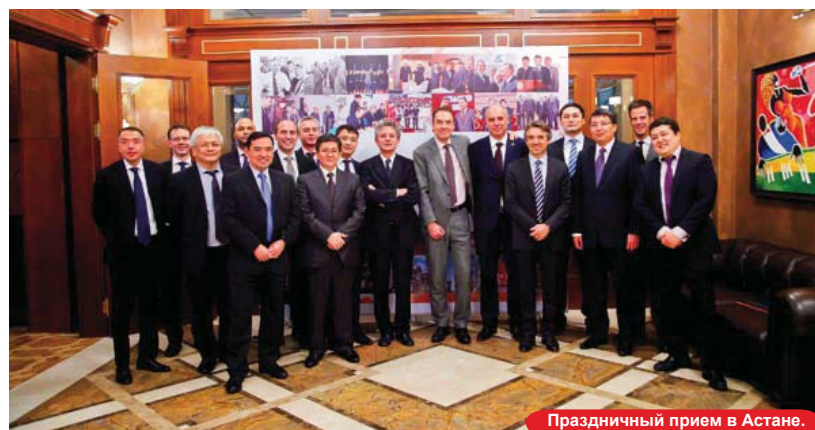
Праздничный прием в Астане.

По оценкам международных экспертов коллектив КПО за эти пятнадцать лет добился максимально возможного успеха. Впереди – планы по дальнейшему наращиванию производства на Карачаганаке. Планируется поступление новых масштабных инвестиций и создание новых рабочих мест. И, как и прежде, – основное место в этой большой работе займут отечественные предприятия. Выступая за устойчивое развитие, социально-ответственное партнерство, повышение местного потенциала, компания КПО продолжит стремиться к новым производственным достижениям на благо Республики Казахстан и партнеров по Карачаганакскому проекту.