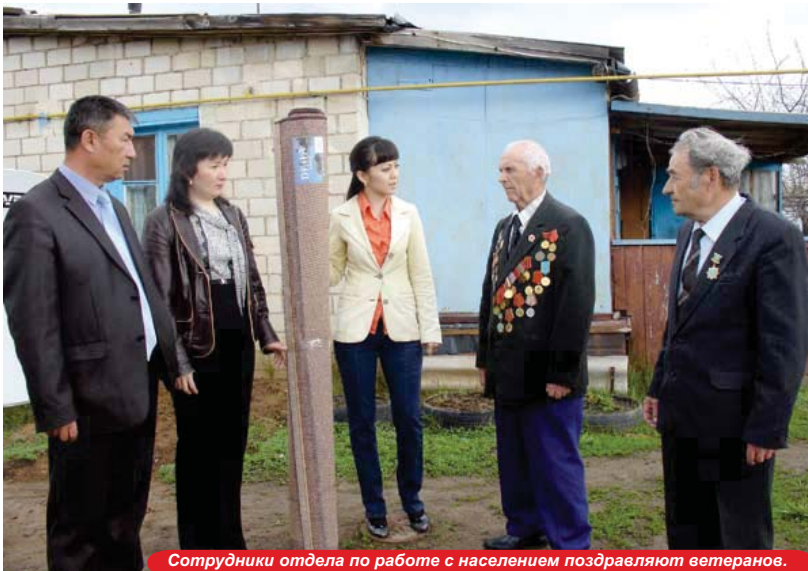
Сотрудники отдела по работе с населением поздравляют ветеранов.

местным населением сложились теплые дружеские отношения. Пожилые люди с большим нетерпением ждут представителей компании, которые приезжают не только с подарками, но и уделяют особое внимание каждому - поговорят с ними, спросят о самочувствии, а старикам больше ничего и не надо, для них важно человеческое отношение, уважение и внимание.