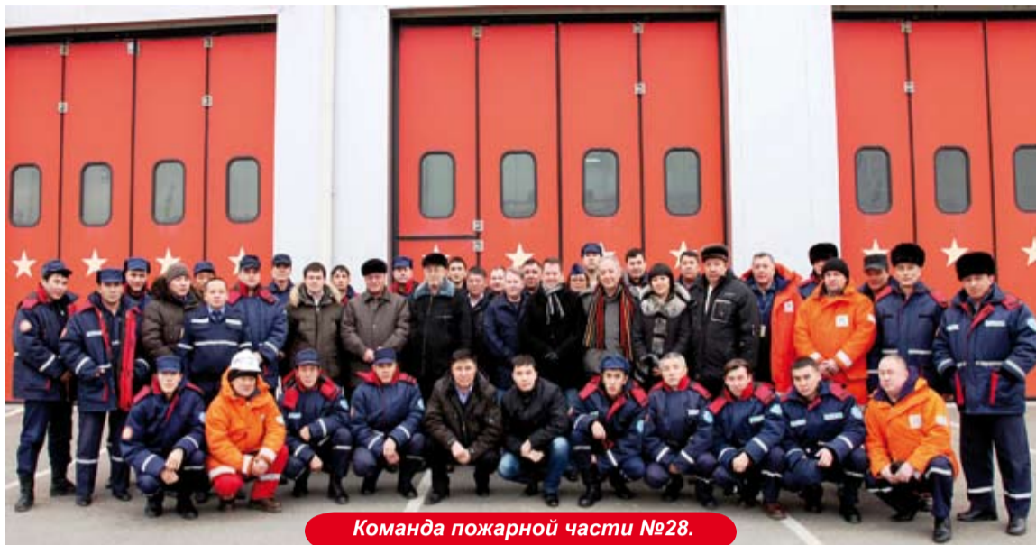
Команда пожарной части №28.

По итогам конкурса «Лучшей пожарной частью 2010 года» была признана пожарная часть №28, ГП-2.