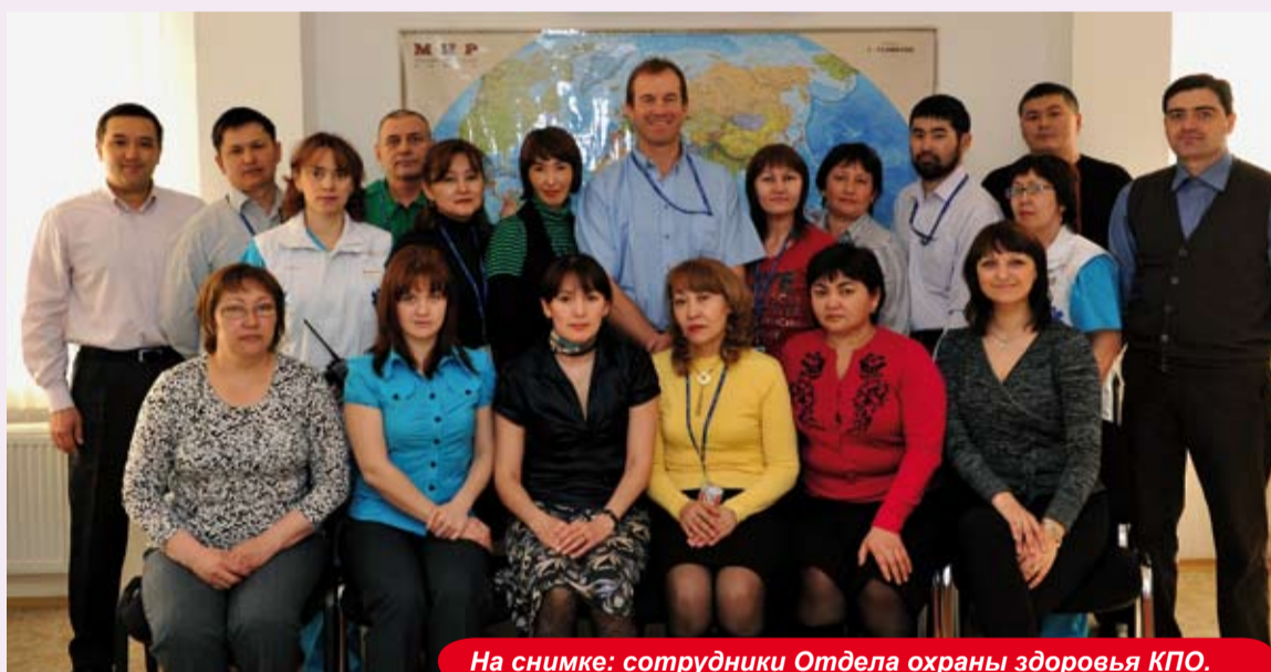
На снимке: сотрудники Отдела охраны здоровья КПО.

Оценка Риска для Здоровья (ОРДЗ) – неотъемлемая часть Стандарта Системы Менеджмен-