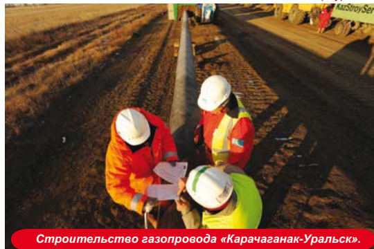
Строительство газопровода «Карачаганак-Уральск».

На форуме также говорилось о том, что начался новый отсчет времени во взаимоотношениях недропользователей и казахстанских предприятий. Значительная роль в сближении интересов отводится созданной совместной рабочей группе.