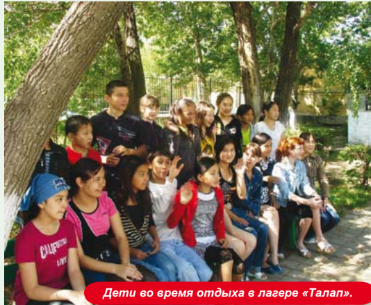
Дети во время отдыха в лагере «Талап».