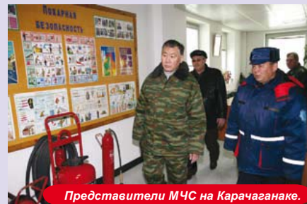
Представители МЧС на Карачаганак.

Во время пребывания делегации Аппарата МЧС РК на Карачаганак, представители КПО рассказали им о технической оснащенности аварийно-спасательных служб, пожарных подразделениях, базирующихся на произ-