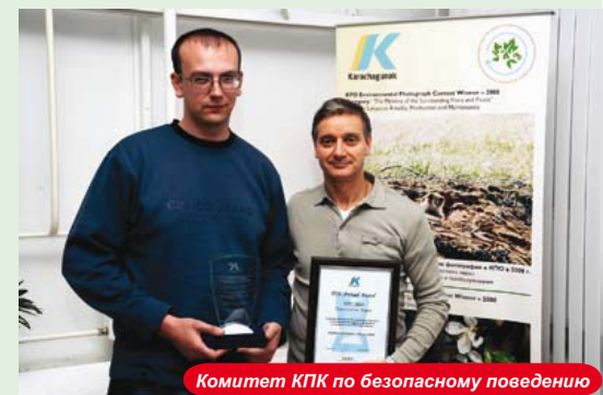
Комитет КПК по безопасному поведению

В категории Повышение потенциала трудовых ресурсов победителем стал