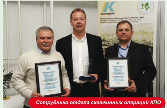
Сотрудники отдела скважинных операций КПО

В категории Безопасная деятельность или инициатива подрядчика победителем стала компания «Саре» за монтаж строительных лесов.