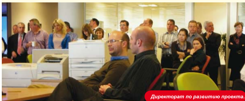
Директорат по развитию проекта.

В этом году на соискание премии было подано еще большее число заявок. Проектная группа по IV-й технологической линии является одной из трех финалистов КПО на данный момент, представившей всего 14 предложений, которые получили соответствующее развитие.