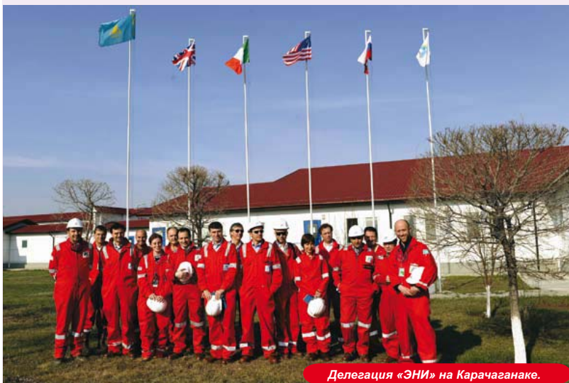
Делегация «ЭНИ» на Карачаганаке.