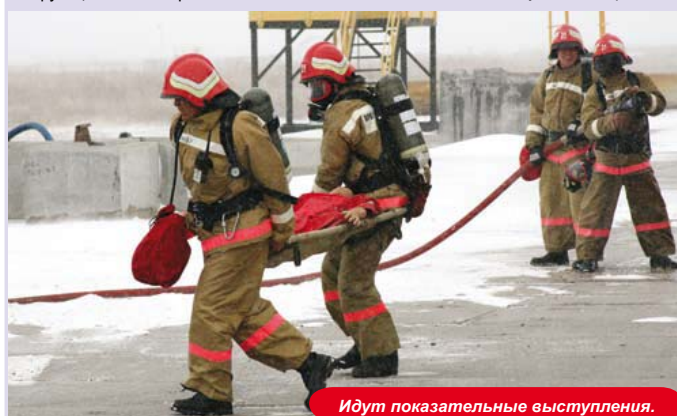
Идут показательные выступления.

Также было отмечено, что демонстрация аварийно-спасательных и противопожарных мер была проведена на высоком профессиональном уровне, продемонстрировав полную оперативную готовность к ликвидации различного рода аварийных ситуаций на Проекте.