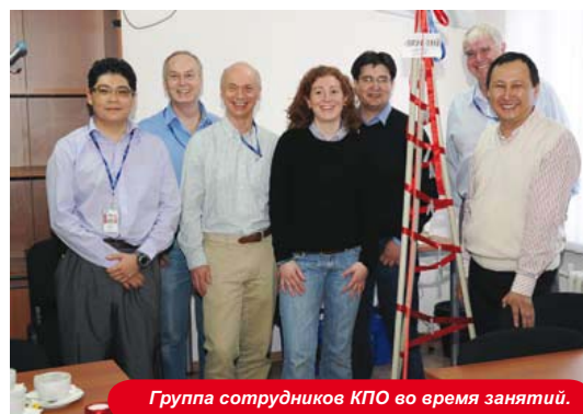
Группа сотрудников КПО во время занятий.

Основные положения этой программы заключаются в следующем: Эффективное использование преимуществ культурного разнообразия и развитие межкультурной компетентности; Обучение в области межкультурной коммуникации для повышения уровня терпимости и улучшения повседневного кросс-культурного взаимодействия; Обучение руководителей и сотрудников компании межкультурному взаимодействию и повышение способности успешно управлять персоналом.