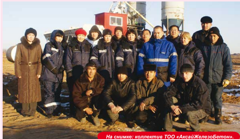
На снимке: коллектив ТОО «Аксай Железобетон».

нируется добыть 72,5-73 млн. тонн нефти, сообщил министр энергетики и минеральных ресурсов Сауат Мынбаев. «Пока не рассчитываем на снижение объемов добычи нефти», - сказал он в интервью агентству KазТАГ. *** Добыча газа в Казахстане в 2008 году по сравнению с предыдущим годом увеличилась на 12% - до 33, 2 млрд. кубометров. Такие данные приводятся в кратких итогах деятельности правительства за 2008 год, опубликованных в официальной прессе. «Основной рост добычи газа обеспечивается компаниями «Карачаганак Петролиум Оперейтинг Б.В.», ТОО «Тенгизшевройл», АО «СНПС-АктобеМунайГаз», ТОО «Толкыннефтегаз», - отмечается в документе. Объем экспорта газа (без учета объемов карачаганакского газа, направляемого по СВОП-операциям на внутренний рынок) увеличился на 27,6% - до 5,6 млрд. кубометров. Объем сжигаемого на факелах газа снизился на 34,7% до 1,8 млрд. куб. м. На нефте- и газоперерабатывающих предприятиях произведено 1,4 млн. т сжиженного углеводородного газа, что на 0,7% больше показателей 2007 года. Объем потребления природного газа областями республики увеличился на 2,7% и составил 8,8 млрд. куб. м. *** Национальная нефтегазовая компания Казахстана «КазМунайГаз» подписала с российским «Газпромом» протокол о поставках газа на казахстанский внутренний рынок в 2009 году в объеме 4,6 млрд. куб. метров, сообщил министр энергетики и минеральных ресурсов РК Сауат Мынбаев.