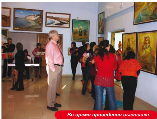
Во время проведения выставки.