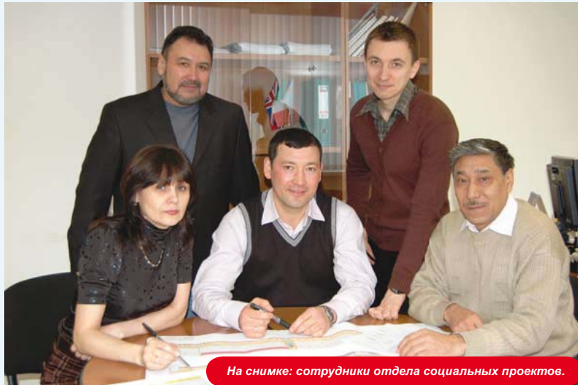
На снимке: сотрудники отдела социальных проектов.

На протяжении многих лет отдел социальных проектов КПО не только активно участвует в социальной жизни региона, но и тесно сотрудничает с ведущими