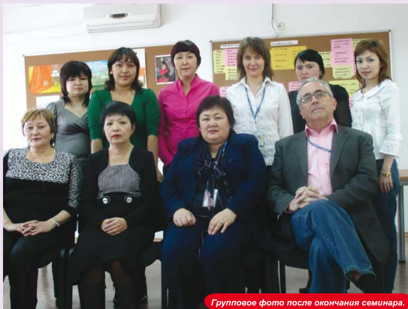
Групповое фото после окончания семинара.

зуя огромный опыт восьми учителей казахского языка. «Здесь в КПО мы стараемся создать центр по изучению казахского языка, который незаслуженно игнорировался долгое время. В настоящее время мы работаем по своей собственной методике и хотим выпустить пособие по