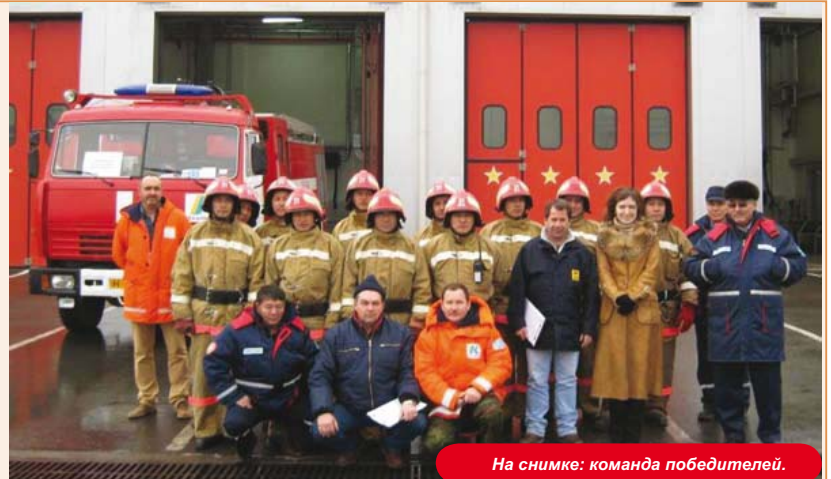
На снимке: команда победителей.

По итогам конкурса победителем стала пожарная команда станции FS-31.