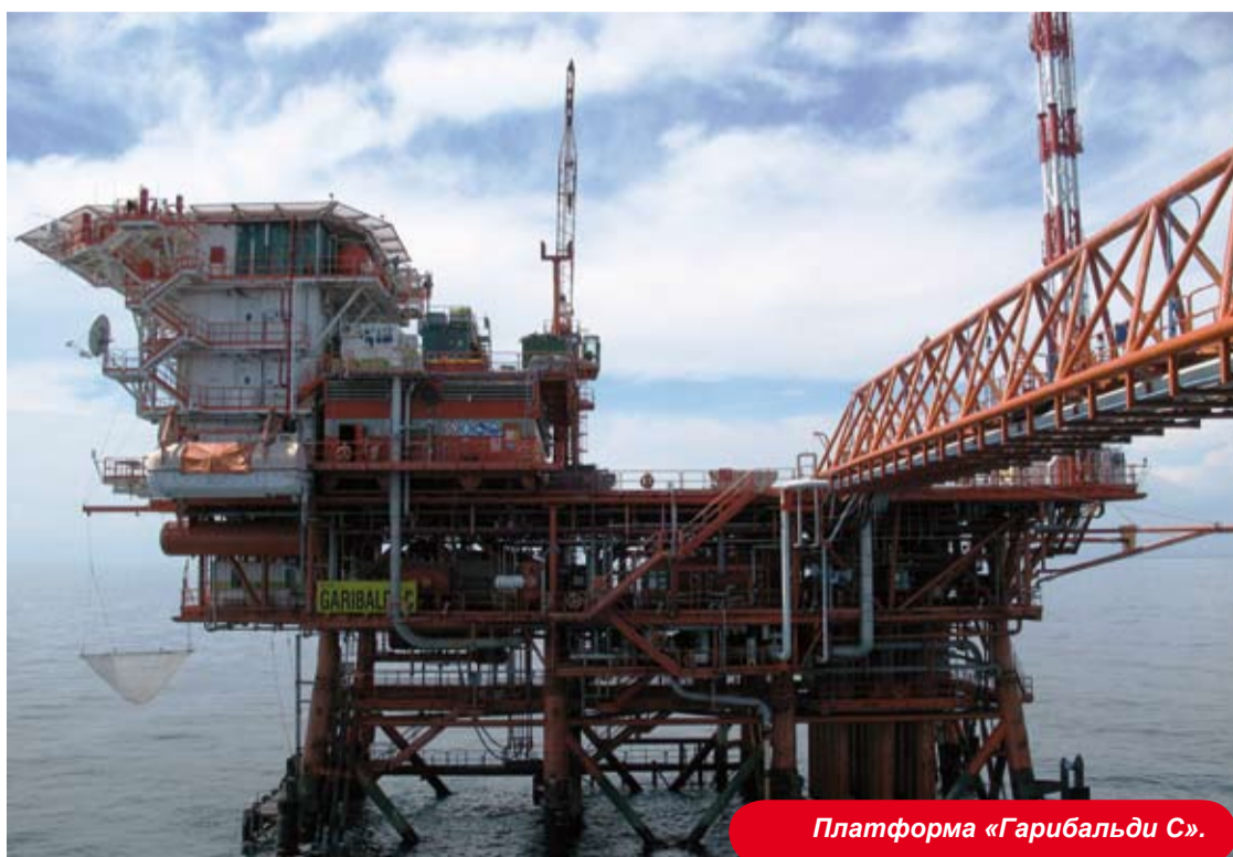
Платформа «Гарибальди С».

— Три года на Карачаганак были для меня не только временем интересной работы, но и замечательного жизненного опыта, — говорит он. — Это открытое общество, народ, которому присущи удивительное гостеприимство и радушие. Старушка Европа должна осмыслить те экономические достижения, которых удалось достичь молодому независимому государству за столь непродолжительный срок. И совершенно неверно считать, что Казахстан — только край неоглядных степей. Его природа прекрасна и многообразна. Для меня незабываемы рыбалка на реке Утва и охота в пойме Урала. И конечно, особого уважения заслуживает политика согласия и стабильности в этой интересной и многонациональной стране.