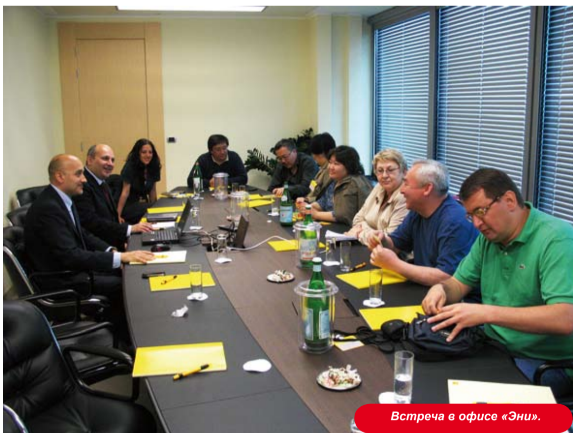
Встреча в офисе «Эни».