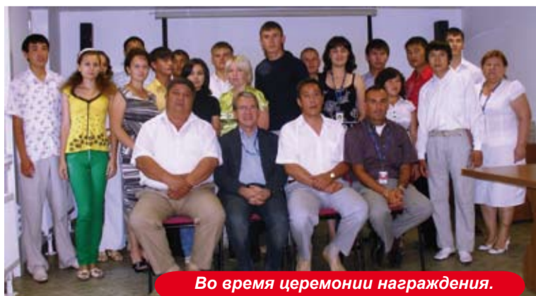
Во время церемонии награждения.

Основная цель Программы - подготовить инженерные кадры всех уровней, которые смогли бы успешно применить свои знания в дальнейшем на промышленных объектах КПО. Таким образом, компания КПО продолжает выполнение своих обязательств по ОСРП, направленных на развитие и обучение