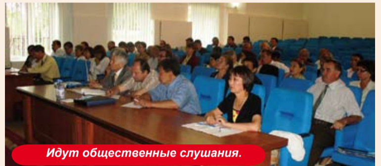
Идут общественные слушания.

Проектировщики также заверили общественность в обеспечении безопасности и мерах,