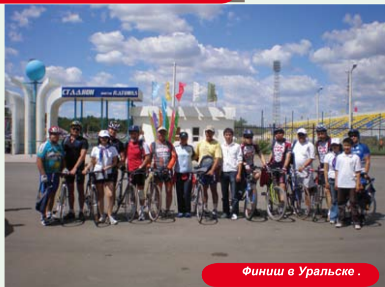
Финиш в Уральске.