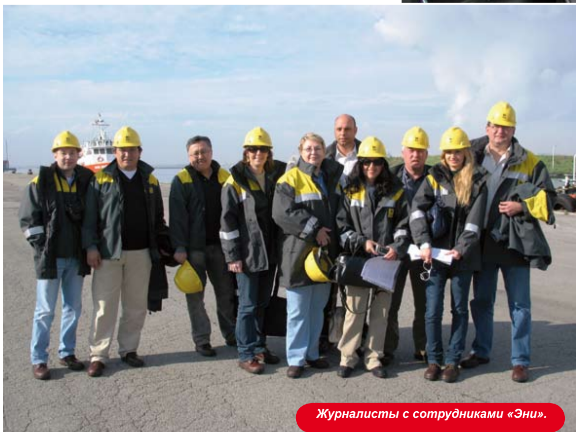
Журналисты с сотрудниками «Эни».

объемов добычи. Сложность же состоит в том, что прежним оператором извлечение углеводородов велось из верхнего слоя. Теперь же разрабатываются более глубокие пласты. Что, конечно же, сопряжено с большими затратами. Но КПО идет на них для повышения эффективности промысла. Приходится задействовать дополнительные компрессоры. Впервые в мировой практике именно на Карачаганаке применена технология обратной закачки газа в пласт. Эффект при этом достигается двойной. Практически сведена к нулю необходимость сжигания сопутствующего газа на факелах, что связано со значительным улучшением экологических показателей. Одновременно повышается пластовое давление. Затем подобная практика использовалась на Тенгизе. В перспективе будет применяться и на Кашагане.