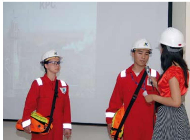
На снимках: во время презентации, посвященной Программе развития выпускников.