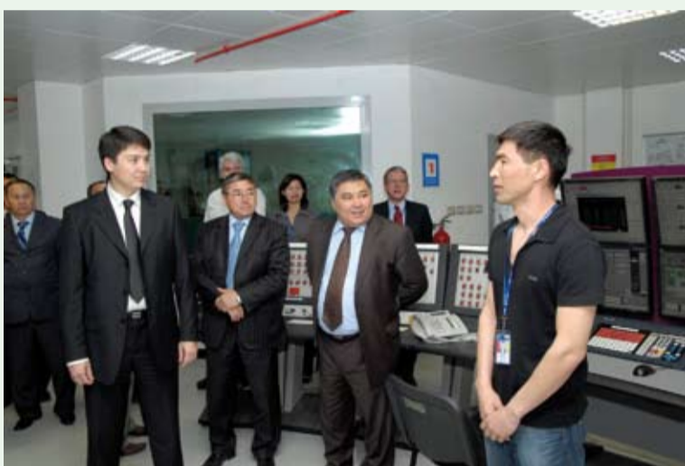
На снимке: посещение диспетчерской КПК.