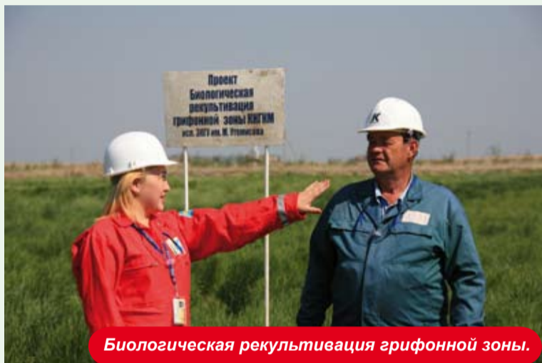
Биологическая рекультивация грифонной зоны.

КПО ведет подготовку к масштабной акции, направленной на улучшение экологического состояния Западно-Казахстанской области. Во время акции планируется проведение целого ряда мероприятий и конкурсов по экологической тематике среди