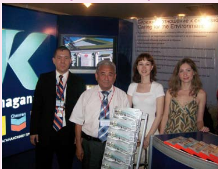
На снимке: команда КПО на выставке «Экотехнологии 2008»

В городе Астана с 3 по 5 июня прошел I Международный Форум «Устойчивое развитие Евразийского континента», который призван стать одним из важных инструментов в объединении международных усилий в сфере развития – в особенности, в