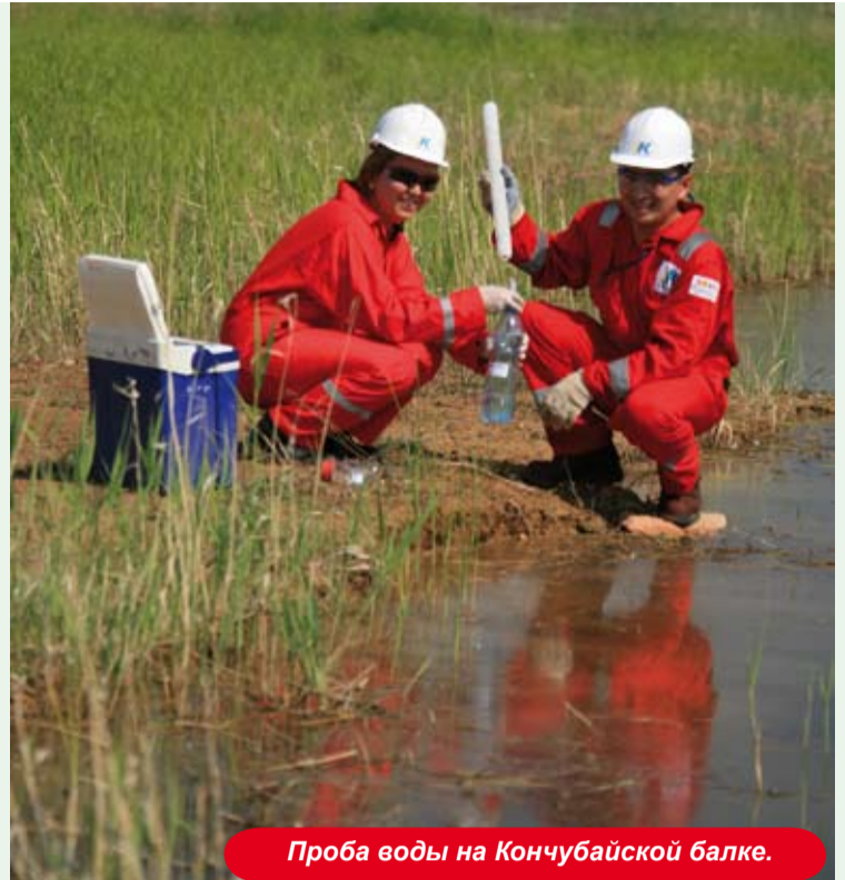
Проба воды на Кончубайской балке.

"Карачаганак Петролиум Оперейтинг" - компания, работающая в строгом соответствии со стратегическим планом развития Госстандарта Республики Казахстан, разработанного с учетом послания президента Нурсултана Назарбаева. Взяв за пример передовые международные стандарты, руководство намерено привести систему экологического менеджмента (СЭМ) в полное соответствие с мировыми требованиями ИСО 14001-2004.