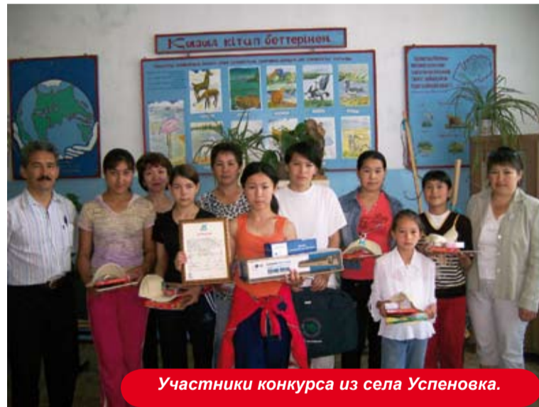
Участники конкурса из села Успенка.