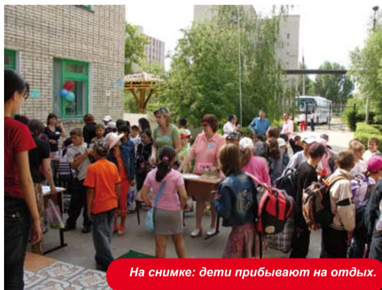
На снимке: дети прибывают на отдых.

Каждый год дети из малообеспеченных семей, а также отличники учебы, проживающие в селах Березовка, Жанаталап, Карачаганак, Успеновка, Жарсуат, Бестау, Приуральное и Димитрово, расположенных вблизи месторождения Карачаганак, поправляют свое здоровье в оздоровительном лагере «Талап». Путевки для них предоставляет компания КПО. Кроме того, для детей и сопровождающих, компания выделяет комфортабельные автобусы, которые привозят детей в оздоровительный лагерь, а после окончания их отдыха развозят всех детей по домам.