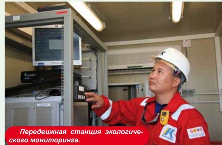
Передвижная станция экологического мониторинга.

Природа - это бесценная кладовая. Запасы ее огромны, но не бесконечны. И поэтому надо с заботой относиться к окружающей среде. Эту мысль руководство компании старается донести до всех своих служащих. Осенью 2007 года в рамках обязательства КПО по обучению государственных служащих в Японии был организован учебный семи-