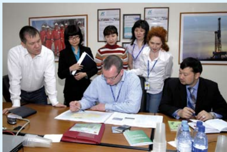
На снимке: Корпоративный отдел по охране окружающей среды КПО.

В семинаре принимали участие сотрудники КПО, группа по разработке проектов из Лондона, работники компаний «BG Group» и «Caspian Engineering and Research».