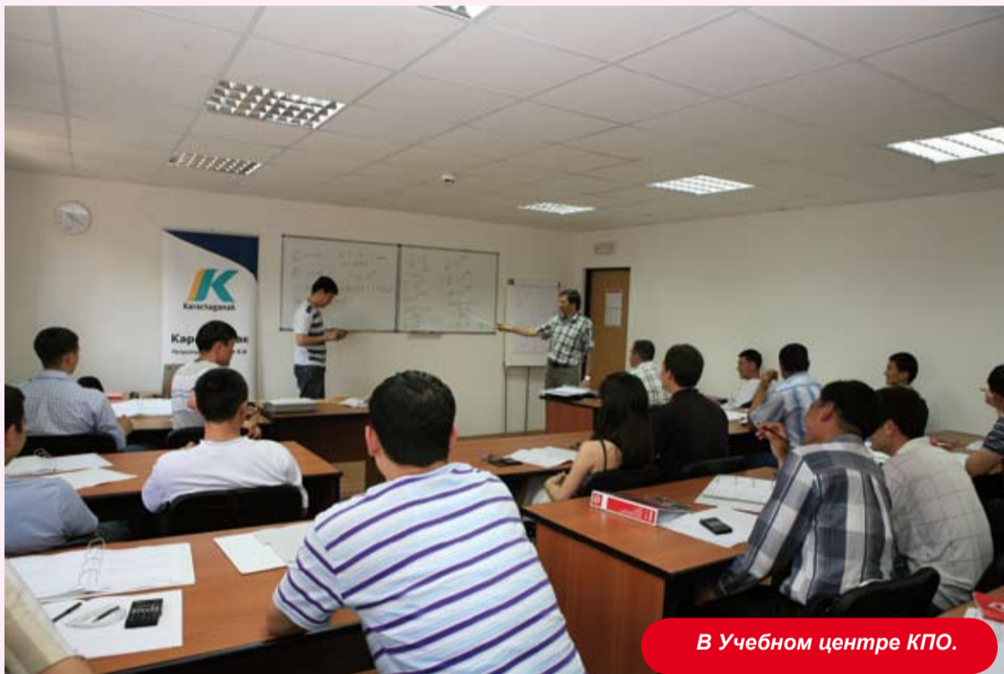
В Учебном центре КПО.

- Можно с уверенностью говорить о том, что трехязычие на месторождении практически уже действует. Если в 2006 году на языковых курсах занимались 200-250 человек, то сейчас уже более 500. Число желающих учить английский, казахский и русский языки продолжает расти. Эти знания востребованы. К тому же есть благоприятная языковая среда. То есть широкие возможности для общения с теми, для кого язык является родным. И, как правило, люди готовы помогать друг другу в овладении знаниями. Занятия ведутся и в Тренинг-Центре, и в пилотном городке, и в Уральске в междувахтовый период. Поэтому каждый может выбрать удобную для себя систему обучения. Программа сегментирована на шесть уровней – от разговорного до свободного владения языком. За краткосрочными курсами следует более сложный этап обучения. Легко работать с теми, кто знает хотя бы еще один язык. Поскольку у этого человека уже отработана система ассоциативного запоминания. Сейчас желающих учиться столько, что пришлось составить так называемый список ожидания. Это касается и других направлений обучения. Поэтому сейчас обсуждается возможность строительства нового Тренинг-Центра.