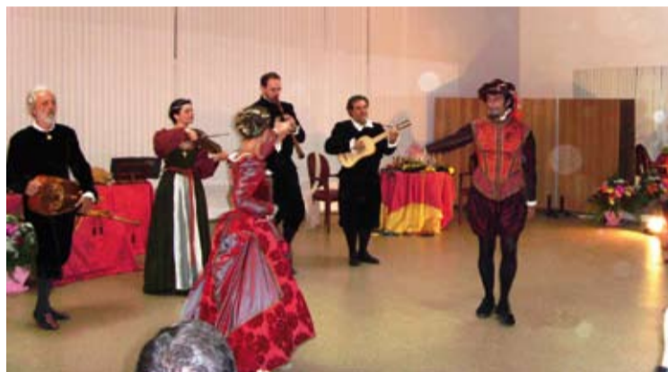
На снимках: во время выступления итальянских артистов в Чешском городке.

Концерт был организован при содействии Итальянского посольства в Казахстане, которое организовало их поездку по стране.