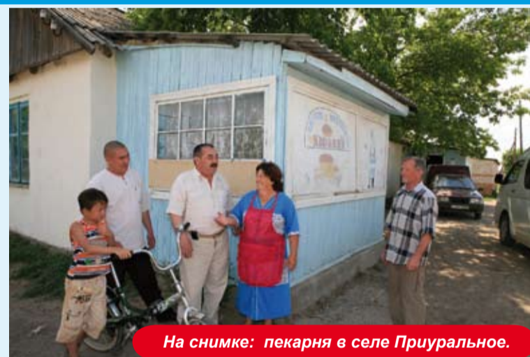
На снимке: пекарня в селе Приуральное.

В 2008 году был подписан меморандум о финансировании дополнительно $250 000 в рамках данного проекта. Итого $500 000. С марта месяца более 50 предпринимателей Березовского, Успеновского, Приурального, Жарсуатского и Кызылталского сельских округов воспользовались кредитом. Для сельчан данное кредитование очень удобно, потому что очень маленькая процентная ставка (с этого года она уменьшена с 10 до 7%). Сельским жителям не нужно самим ездить в банки, так как представитель «ДАМУ» сам приезжает на место и объясняет какие