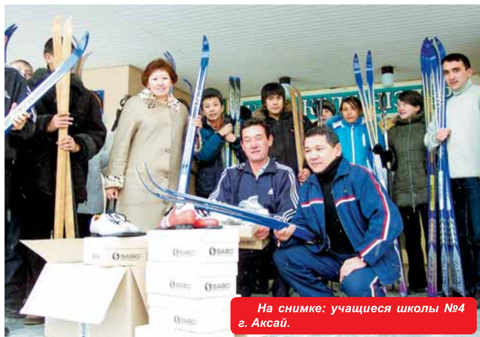
На снимке: учащиеся школы №4 г. Аксай.

Компания КПО уже дарила сельским школам спортивный инвентарь для игр в баскетбол, футбол и волейбол, гимнастические снаряды, маты, канаты, комплекты для занятий настольным теннисом, шашки и шахматы. Комплекты лыжного снаряжения являются отличным дополнением к такому набору спортивного инвентаря».