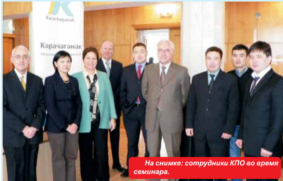
На снимке: сотрудники КПО во время семинара.

В период с 2000 по 2005 гг. контракты на поставку товаров и услуг для КПО были заключены более чем с шестьюстами казахстанскими подрядчиками. Объем казахстанского участия за данный период составил $1.6 миллиарда.