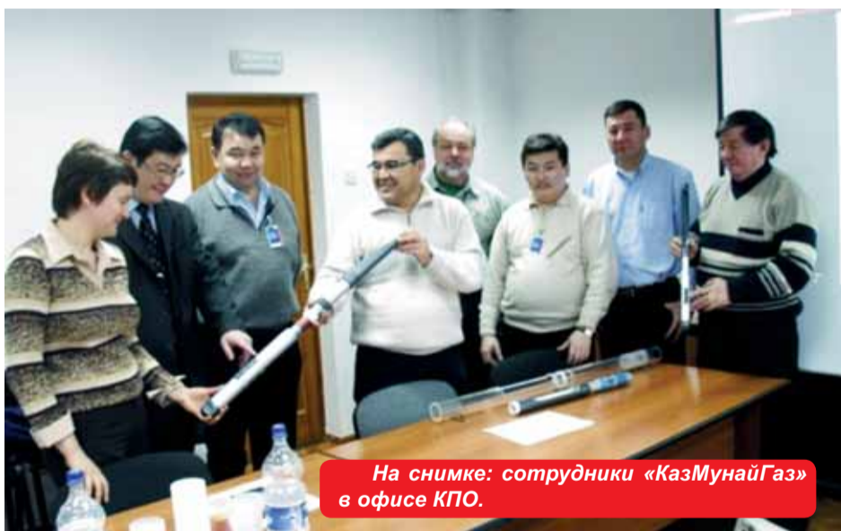
На снимке: сотрудники «КазМунайГаз» в офисе КПО.

экскурсия на Карагаганакское месторождение, посещение главной мастерской КПО, а также буровой вышки. Им были продемонстрированы все необходимые инструмен-