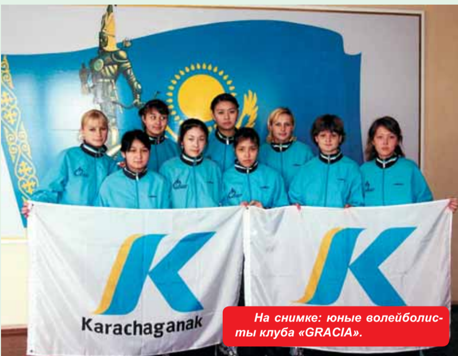
На снимке: юные волейболисты клуба «GRACIA».

Первично-производственная организация общества слепых г. Уральска получила спонсорскую помощь от КПО для приобретения компьютера, принтера, ксерокса и факса. Таким образом, необходимая оргтехника даст