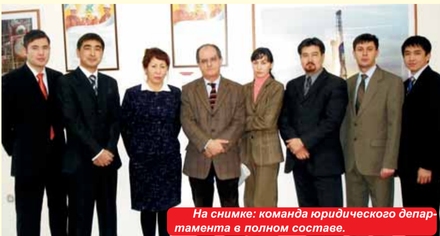
На снимке: команда юридического департамента в полном составе.

Команда юристов КПО состоит из семи казахстанских сотрудников, и многие из них обладают богатым опытом работы в нефтегазовом секторе и зарекомендовали себя с самой лучшей стороны.