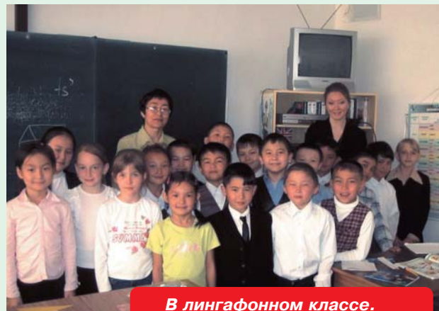
В лингфонном классе.

дущих в Бурлинском районе. Здесь трудятся настоящие профессионалы своего дела, имеющие многолетний стаж по воспитанию детей, а также понимающие всю возложенную на них ответственность. Однако материальная база школы не соответствует уровню развития нашего общества и поэтому учителя школы приходится пользоваться самодельными наглядными пособиями. Особенно это касалось лингфонного кабинета английского языка, который не был оснащен необходимыми техническими средствами, из-за