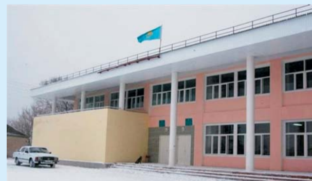
Общий вид Дома культуры

Стоит отметить, что в поселке Жарсуат, в начале учебного года, при помощи КПО была также полностью отремонтирована школа, построен-