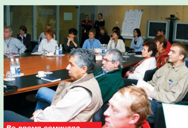
Во время семинара

Оно было посвящено разработке бизнес-планов уча-