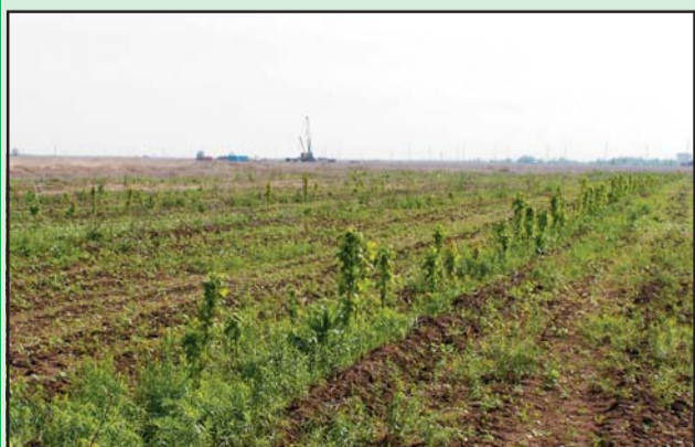
На снимках: идет процесс восстановления земли.