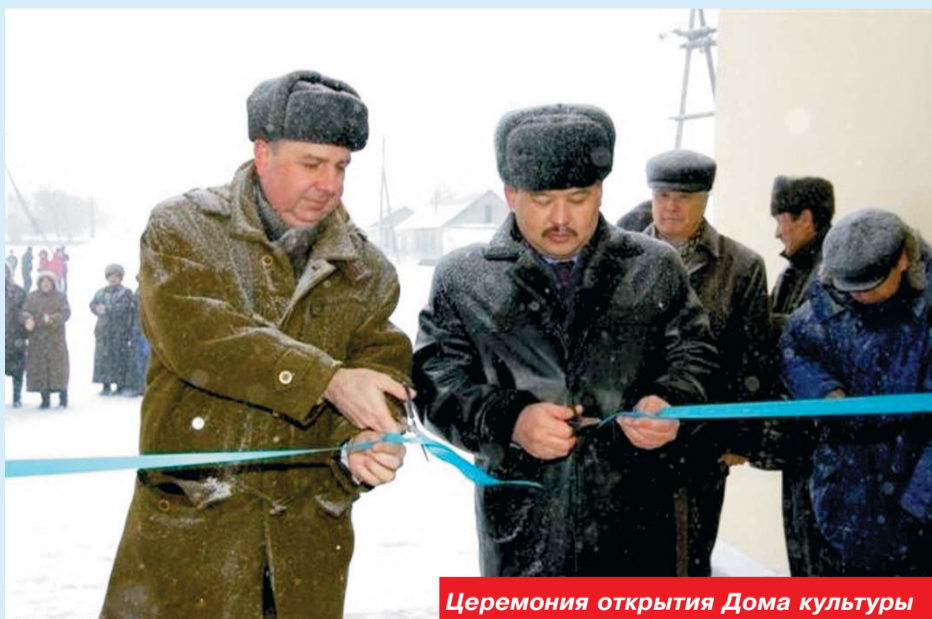
Церемония открытия Дома культуры

В канун Дня независимости и Нового года жители поселка Жарсуат получили еще один замечательный подарок от компании КПО. Здесь 14 декабря состоялось торжественное открытие Дома культуры, реконструкция которого была выполнена в рамках ежегодной социальной программы, финансируемой КПО.