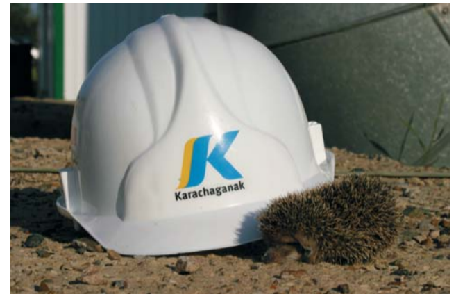
На снимках: экологи КПО проводят наблюдение; живая природа Карачаганака.