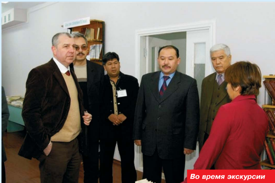
Во время экскурсии

ная в 1964 году, вмещающая более 200 учеников. Капитальный ремонт школы был выпол-