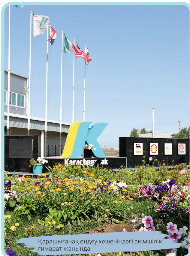
Қарашығанақ өңдеу кешеніндегі әкімшілік ғимарат жанында

Коронавируспен байланысты жағдайға орай, 2020 жылы нормативтік-құқықтық сәйкестікті қамтамасыз ету бөлімінің қызметкерлері бетпе-бет оқытуларды онлайн форматқа көшірді. Осылайша, оффлайн оқудан өтуге тиісті барлық КПО қызметкерлері үшін қашықтықтан оқытудың бірнеше сессиялары сәтті ұйымдастырылды.