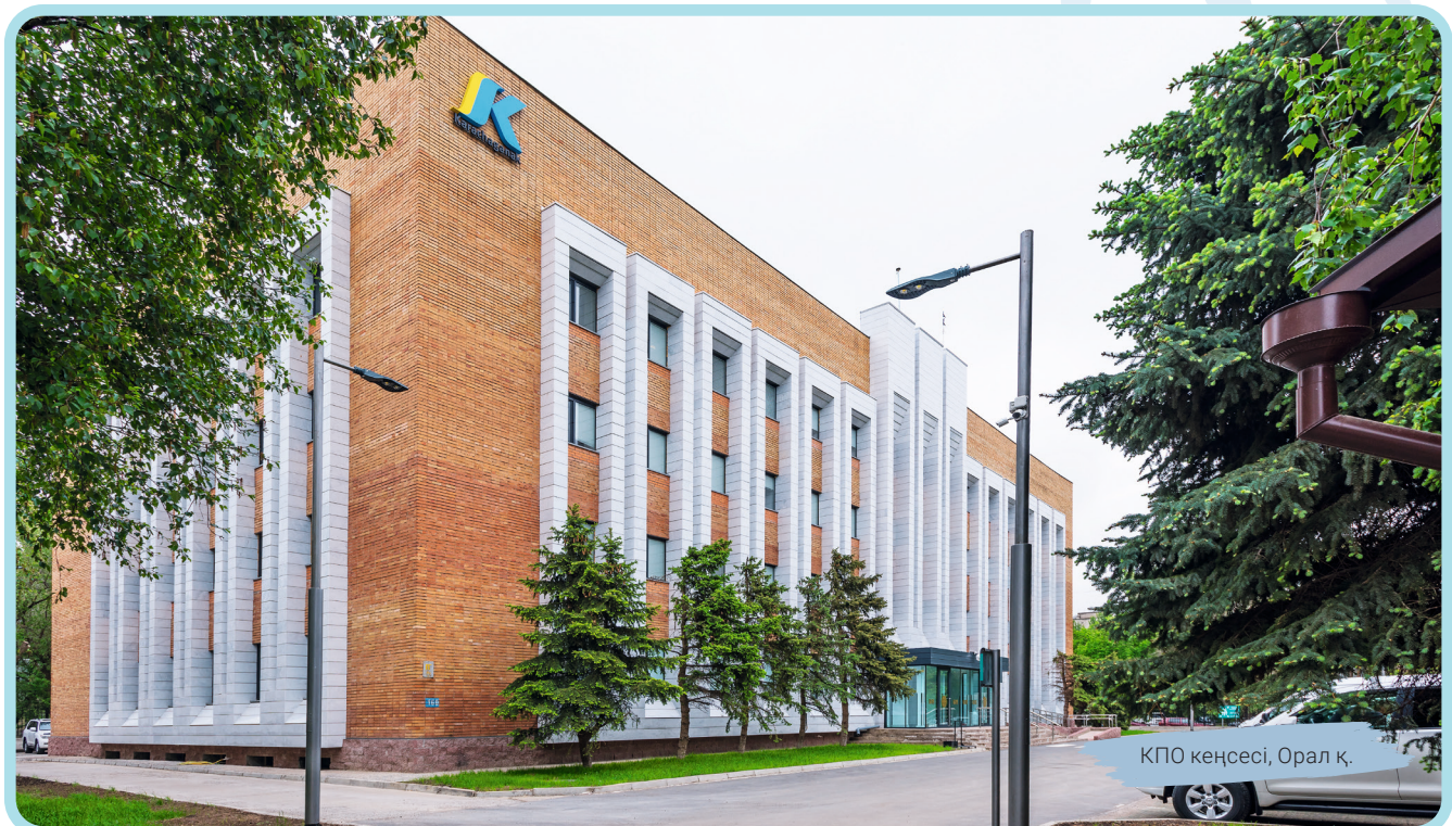
КПО кеңсесі, Орал қ.

Компанияда аталмыш комитеттерден басқа шағын комитеттер құрылған. Басқарудың толық құрылымы графикалық түрде 6-суретте көрсетілген. Комитеттер мен шағын комитеттердің қызметтері 2018 жылғы «Тұрақты даму туралы есепте» жете айтылған (33-34 бет).