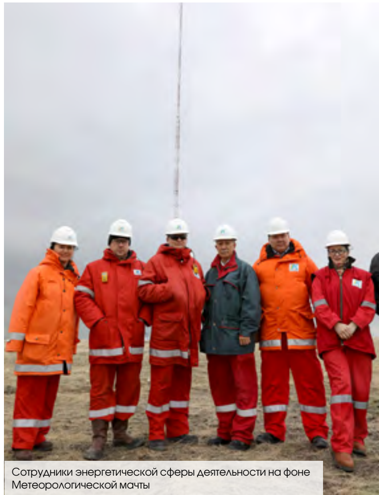
Сотрудники энергетической сферы деятельности на фоне Метеорологической мачты

В 2022 году КПО уделила внимание улучшению качества работ по техническому обслуживанию ВЛ-110 кВ и 35 кВ, во время которых были проведены детальные низовые инспекции состояния бетонных оснований крепления опор, выборочные верховые осмотры изоля-