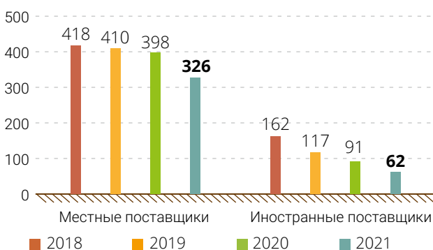
Граф. 26. Поставщики и подрядчики КПО, 2019 – 2022 гг.