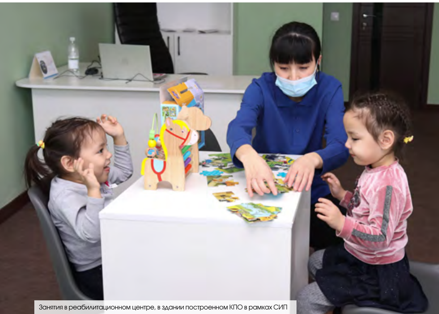
Занятия в реабилитационном центре, в здании построенном КПО в рамках СИП

Также, в 2022 году были начаты работы по реализации ряда социально-инфраструктурных проектов, таких как строительство физкультурно-оздоровительного ком-