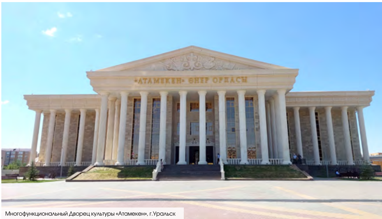
Многофункциональный Дворец культуры «Атамекен», г.Уральск

плекса на 160 зрительных мест в с. Тайпак Акжаикского района, строительства визит-центра «Хан Ордасы», строительства школы на 108 мест в с. Пойма Теректинского района и завершения строительства физкультурно-оздоровительного комплекса на 320 зрительных мест в поселке Чапаево Акжаикского района. В целях улучшения качества образования и освоения образовательных программ, в 2022 году КПО вручила контракты на строительство 14 малокомплектных школ на 108 и 60 мест в районах области. ЦУР 4.а