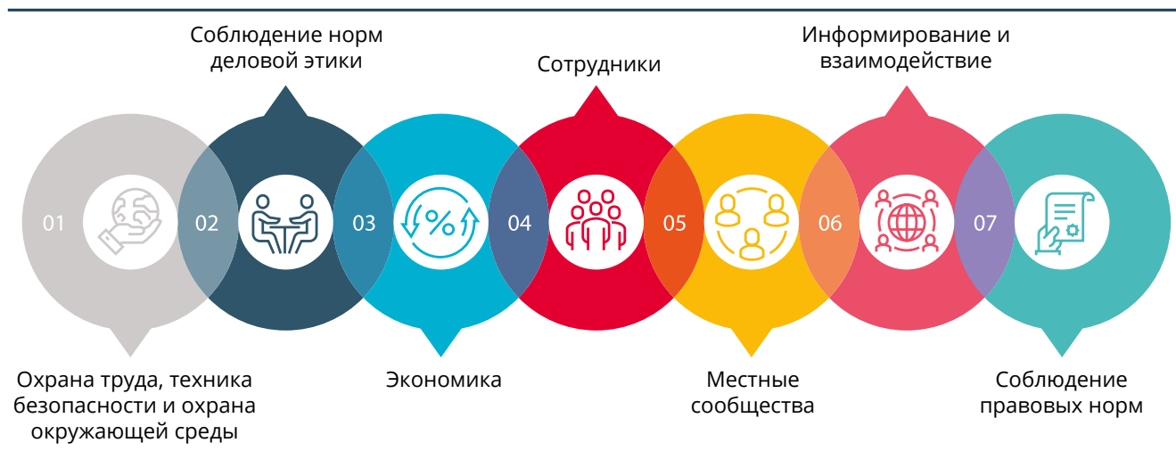
Рис. 7. Деловые принципы КПО охватывают семь основных категорий:

КПО придерживается подхода «абсолютной нетерпимости» к современному рабству и детскому труду, и обязуется выявлять и сводить к минимуму, насколько это возможно, использование детского труда, возникновение рабства и торговли людьми в своих цепочках поставок и во всех сферах своей деятельности. В 2022 году в КПО и ее подрядных организациях не было зарегистрировано случаев применения детского труда и торговли людьми.